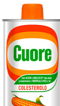
Olio di Mais