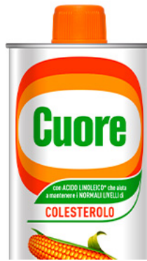
Olio di Mais